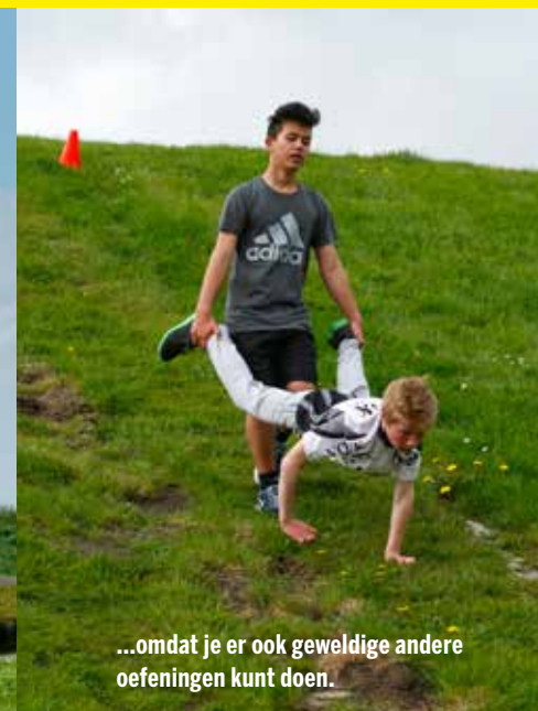
...omdat je er ook geweldige andere oefeningen kunt doen.