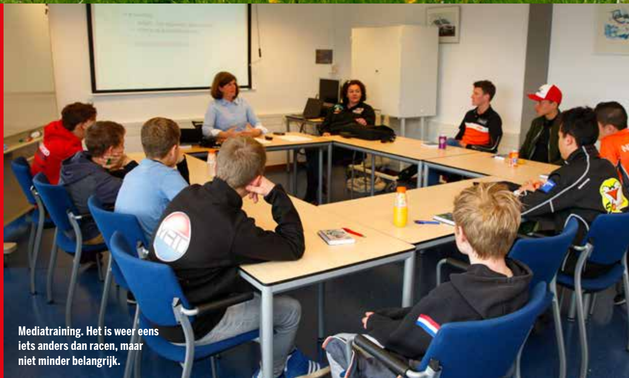
Mediatraining. Het is weer eens iets anders dan racen, maar niet minder belangrijk.

Talent, check. Opleidings-traject, check. Topcoaches, check. Locaties, mwah. Natuurlijk, we hebben de schitterende TT Junior Track en een aantal kartbanen, maar meer circuits zijn welkom. Net als hoogteverschil en een wat centrale ligging. Het debuteert op het oefencircuit van de politie in Lelystad kon niet op een beter moment komen.